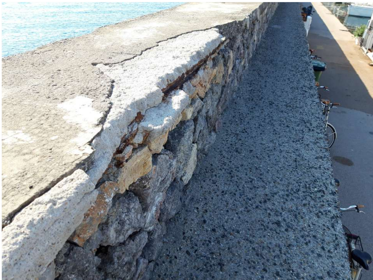
Foto n. 1 – Camminamento del molo oggetto di consolidamento superficiale della pavimentazione, dei frontalini e dell'installazione del parapetto.