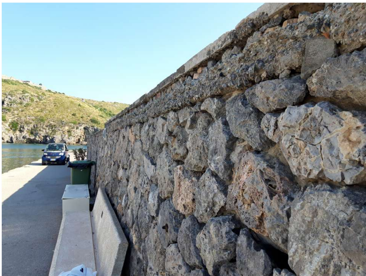
Foto n. 2 – Veduta laterale del camminamento del molo S. Barbara e delle lacune sul muro in pietra.