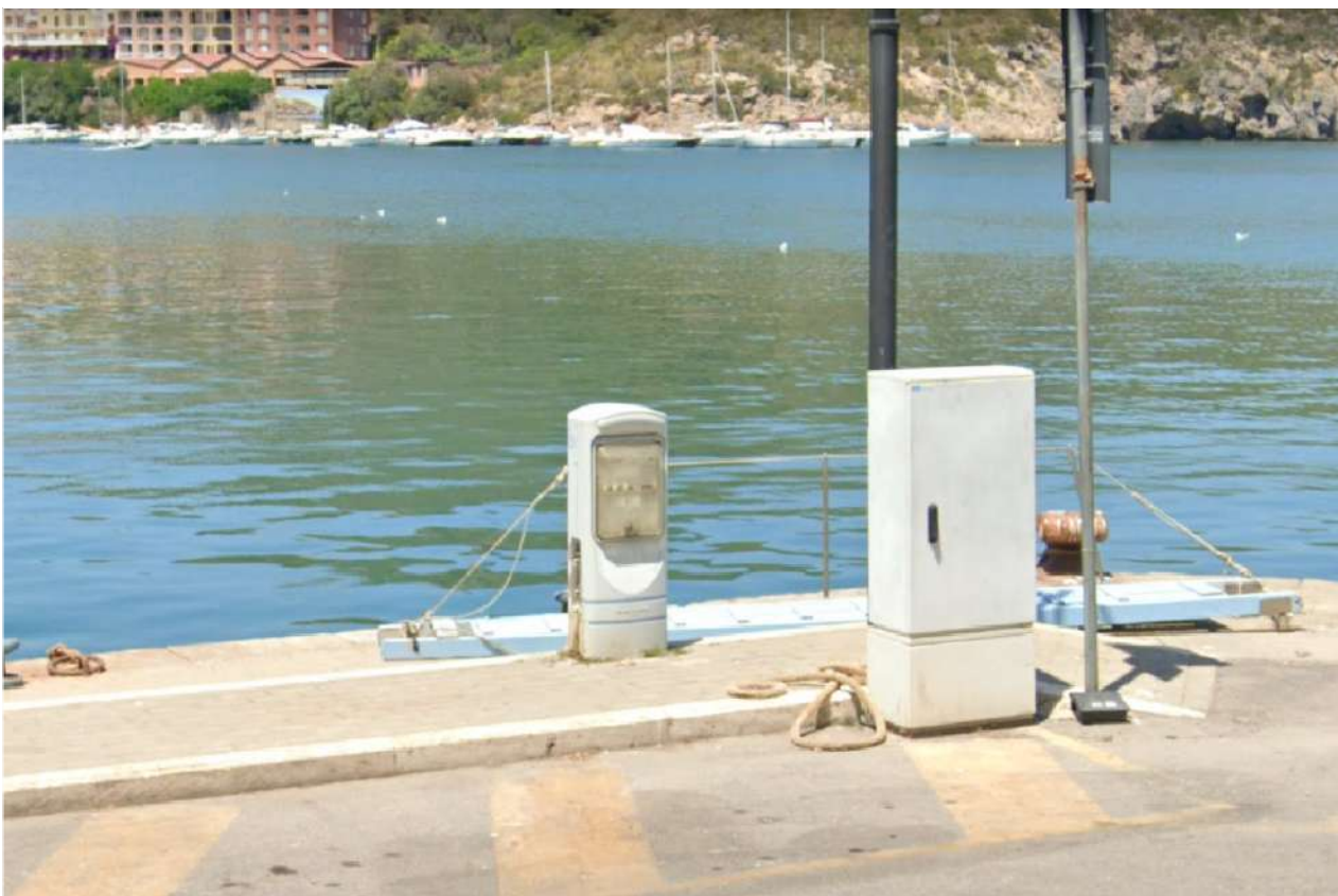
Foto n. 4 – Veduta generale delle colonnine per l'erogazione di energia elettrica e acqua